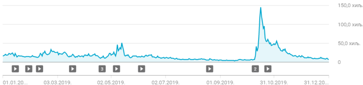
Dnevna gledanost Jutjub kanala Potrošački savetnik tokom 2019.

U proseku, prilozi na našem Jutjub kanalu imali su 18.267 pregleda dnevno.